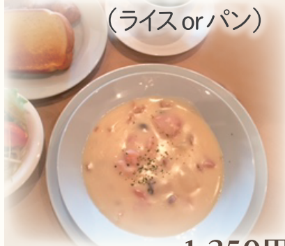
クリームシチュー (ライスorパン)