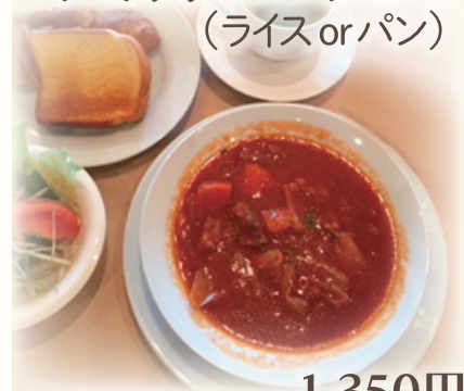
トマトクリームシチュー (ライスorパン)