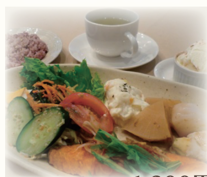
ストーリアセット (魚・五穀米・サラダほか)