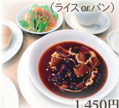
ビーフシチュー (ライスorパン)